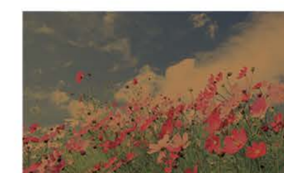
عدسی رنگی قهوه ای ۷۵٪