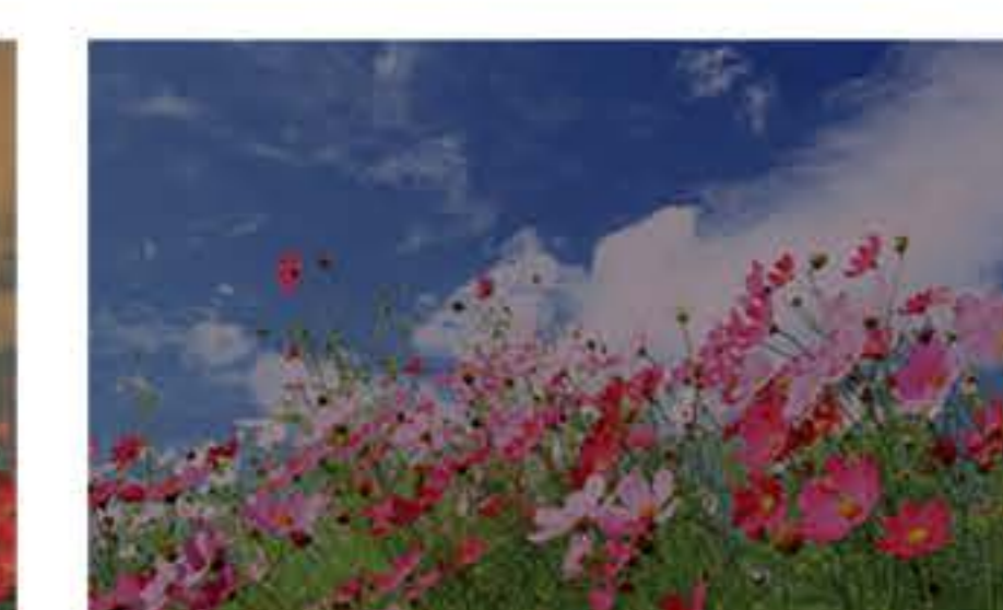
عدسی رنگی دودی ۷۵٪